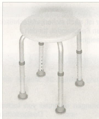
Shower stool complete